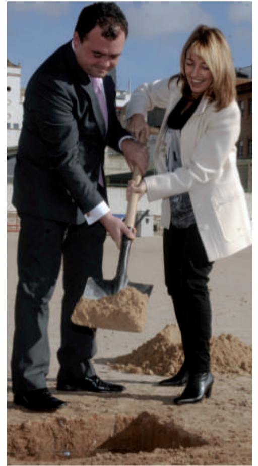
El alcalde de Utiel y la consellera de Deporte colocan la primera piedra

deportiva y lúdica para todos y en el centro de la localidad. La aportación de la conselleria proviene del Plan