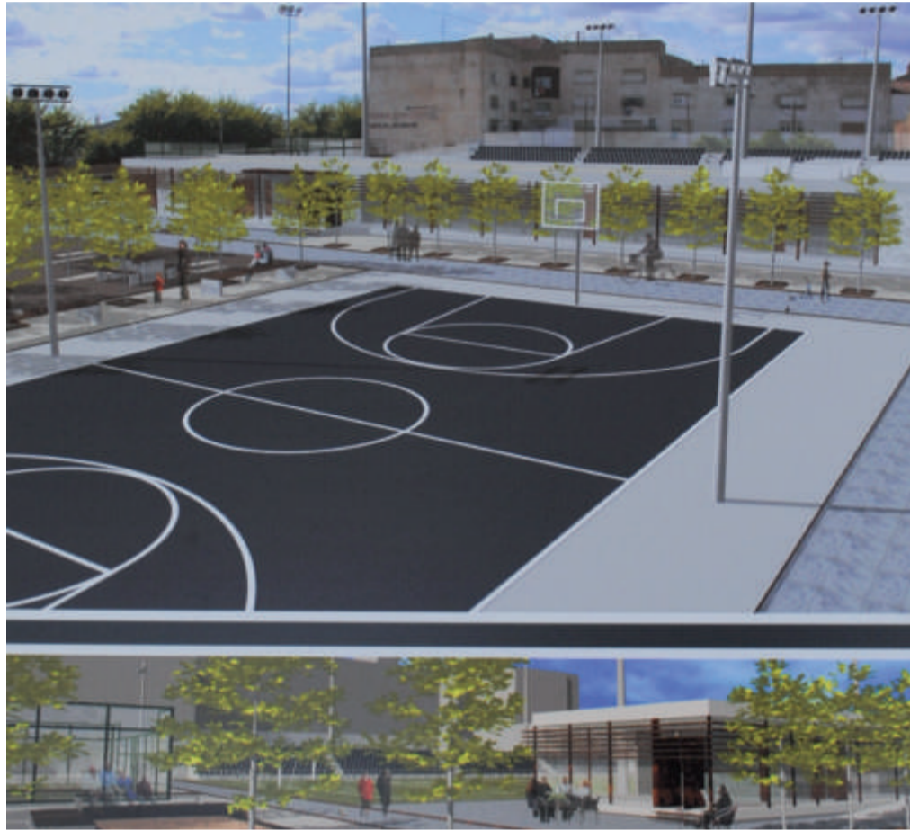
Proyecto de la nueva zona recreativa El Nogueral con nuevas pistas deportivas y zonas verdes de recreo

Uno de los objetivos que mueven este proyecto también es diversificar tanto