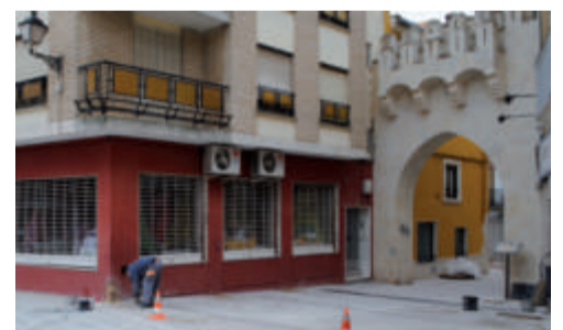
Puerta de las Eras

También a través del Plan Confianza se están invirtiendo 58.430€ y 79.517€ en la calle Huerta Torán y la calle Cavera respectivamente, para la renovación del alcantarillado y de las instalaciones de agua potable. Además se están realizando mejoras para canalizar las aguas de lluvia. Estas obras pertenecen a un proyecto general de unificación de la imagen del casco antiguo, por eso se está cambiando el pavimento de estas calles por adoquines y se está trabajando también en la calle del Pozo, calle Amargosas, calle Serratilla, calle Arco y calle Santa María.