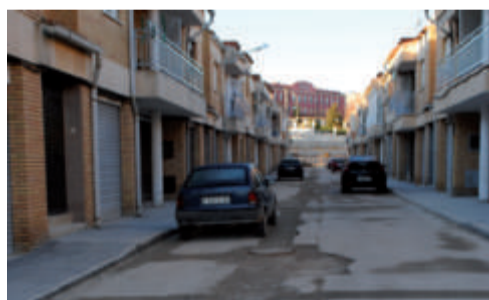
Barrio San Isidro

En una apuesta por modernizar nuestras calles, el Ayuntamiento ha puesto en marcha una serie de obras. La mayoría han sido adjudicadas a empresas y arquitectos utielanos, por eso con estos proyectos el consistorio apuesta por reactivar la economía del municipio, a la vez que mejora la calidad de vida de los ciudadanos. Ya han comenzado las obras de reasfaltado y renovación del mobiliario urbano de la Avenida del Deporte. Esta actuación cuenta con un presupuesto de 115.668€ aportados íntegramente por la Diputación.